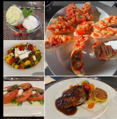
Captains Cup Leckerbissen